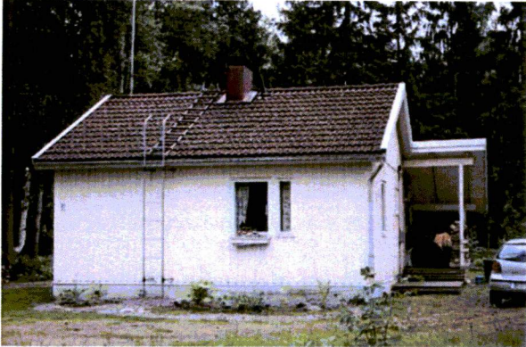
73F Syvärannan Tikka-tyyppitalo.

Tikka-tyyppitalo on rakennettua kulttuurialuetta täydentävä rakennus tai rakennelma