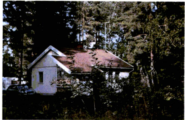
73F Tikkatalo toiselta puolen pihaa.

Syväranta on Tuusulanjärven vanhimpia huvilapalstoja; palstat syntyivät uusjaon yhteydessä 1869-1885